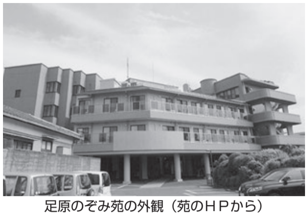
足原のぞみ苑の外観

介護老人福祉施設「足原のぞみ苑」は、足立山を見上げる小倉北区の閑静な住宅街の中にあります。約90人の職員が家族のような快適な介護サービスを提供しています。